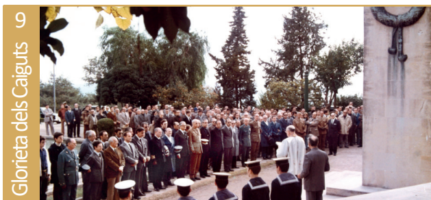
Glorieta dels Caiguts • Via Augusta

Presó on van participar en la seva construcció nombrosos presos republicans a causa de la seva professió de pica-pe-drers i paletes.