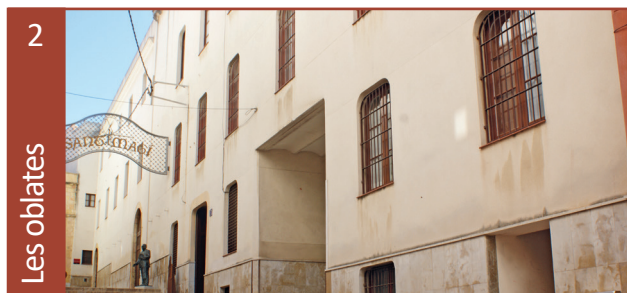
Presó per a dones les Oblates • Portal del Carro, 13

Entre l'any 1939 i el 1948 van passar per aquesta presó uns 10.000 republicans/nes, de les comarques del Camp de Tarragona i les Terres de l'Ebre. Dels quals 691 van ser afusellats, inclosa 1 dona i altres 57 homes hi van morir de malaltia. Va funcionar com a presó provincial fins l'any 1953.