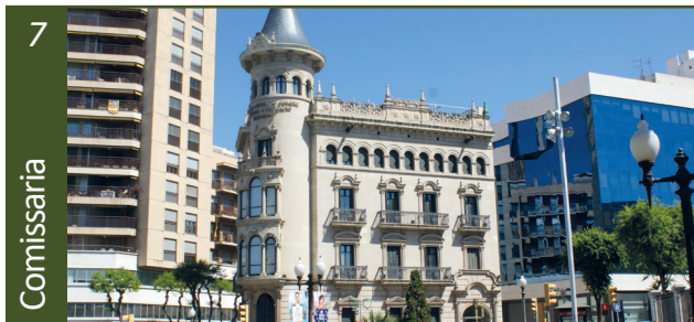
Comissaria de policia • Avinguda Pau Casals, 17

La comissaria de la policia franquista, avui seu de la Cambra de Comerç, és un indret on van patir comunicació i tortures molts republicans, i també posteriorment nombroses persones antifranquistes, que lluitaven pels drets dels treballadors i la Democràcia.