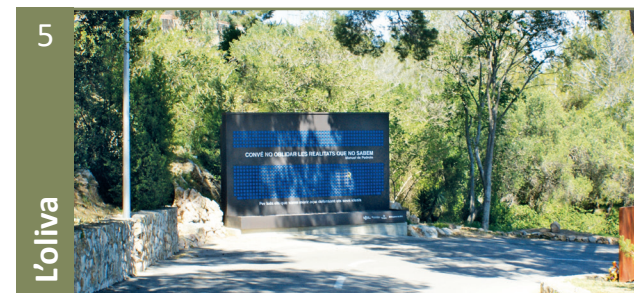
Muntanya de l'Oliva. LLOC DELS AFUSELLAMENTS

Els republicans/nes hi van ser jutjats i jutjades sota els càrrecs de rebel·lió militar, adhesió a la rebel·lió, auxili a la rebel·lió i incitació a la rebel·lió, sense cap garantia processal.