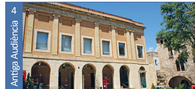
Antiga Audiència. CONSELLS DE GUERRA • Plaça Pallol, 3

El convent dels pares carmelites va ser utilitzat com a presó i camp de concentració dels presos republicans. Actualment és un lloc de culte catòlic.