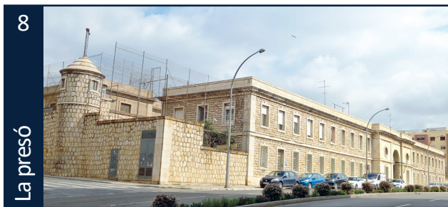
Presó des de 1953 a 2015 • Av. República Argentina, 2

La comissaria de la policia franquista, avui seu de la Cambra de Comerç, és un indret on van patir comunicació i tortures molts republicans, i també posteriorment nombroses persones antifranquistes, que lluitaven pels drets dels treballadors i la Democràcia.