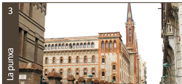
Presó habilitada a la Punxa • Carrer Assalt, 11

L'Església va col·laborar amb la dictadura franquista posant a la seva disposició els seus establiments. Al convent de les Oblates van morir 11 dones a conseqüència de les inhumanes condicions carceràries a que van ser sotmeses.