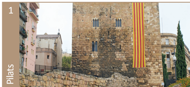
Presó de Pilats • Pl. del Rei

Entre l'any 1939 i el 1948 van passar per aquesta presó uns 10.000 republicans/nes, de les comarques del Camp de Tarragona i les Terres de l'Ebre. Dels quals 691 van ser afusellats, inclosa 1 dona i altres 57 homes hi van morir de malaltia. Va funcionar com a presó provincial fins l'any 1953.