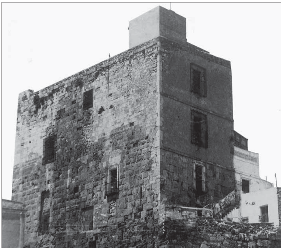
La torre de l'antiga presó de Pilats.