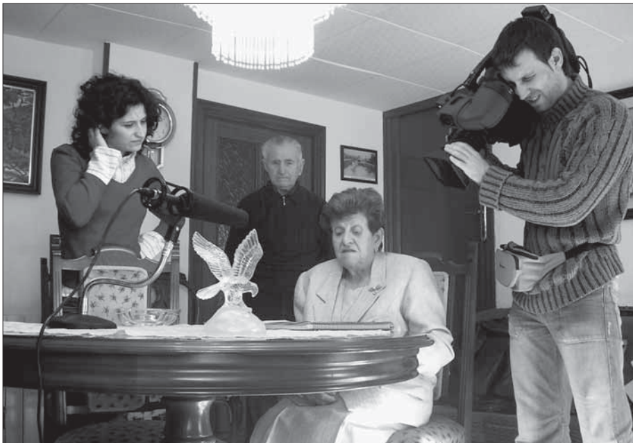
Imatge del making of d'una de les entrevistes realitzades als informants.